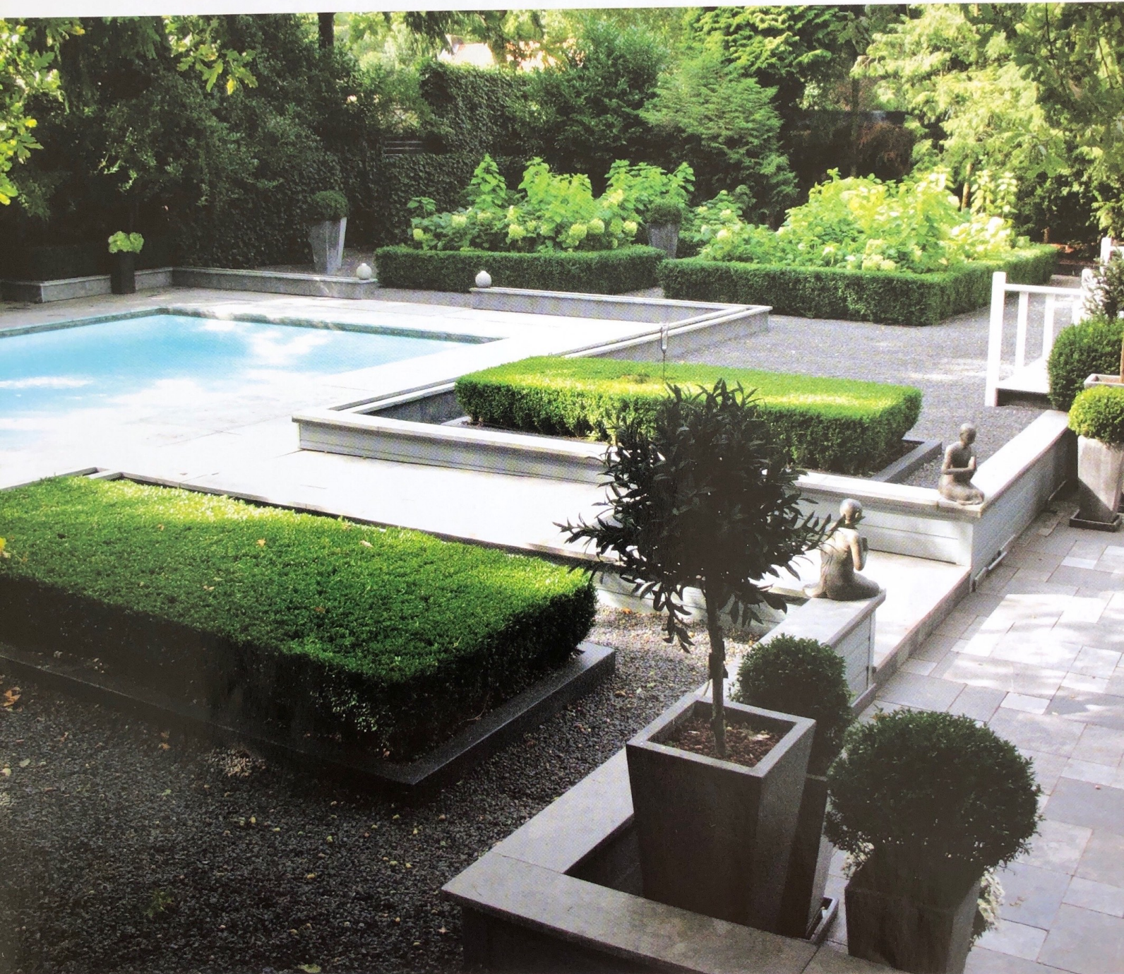
De tuin werd onderhoudsvriendelijk aangelegd, met natuurstenen terrassen, wandelpaden van grijs split en perken en buxushagen in een geometrisch samenspel.